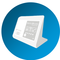
Transmetteur de chevet

Le transmetteur est le moyen de communication entre votre dispositif cardiaque et le système de télécadiologie. Celui-ci peut prendre la forme d'un objet physique , appelé transmetteur de chevet , ou d'une application mobile sur smartphone .