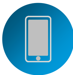
Application mobile smartphone