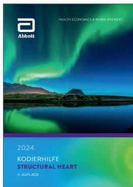
Kodierhilfe Structural Heart