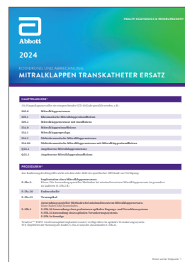
Mitralklappen Transkatheter Ersatz

WEITERE INFORMATIONEN UND KODIERHINWEISE FINDEN SIE UNTER