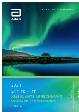
Kodierhilfe Ambulante Abrechnung Cardiac Rhythm Management