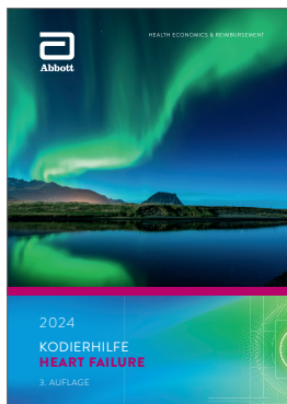
Kodierhilfe Heart Failure