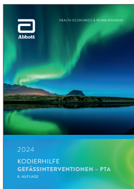
Kodierhilfe Gefäßinterventionen – PTA